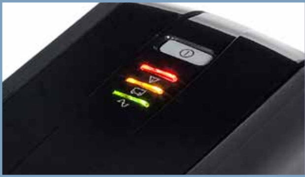
Detalle del led